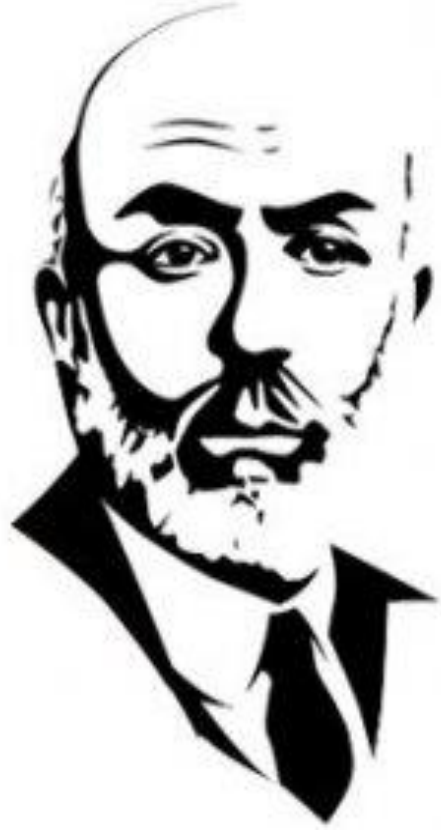
Mehmet Akif ERSOY

Dalgalan sen de şafaklar gibi ey şanlı hilal! Olsun artık dökülen kanlarımın hepsi helal. Ebediyen sana yok, ırkıma yok izmihlal: Hakkıdır, hür yaşamış, bayrağımın hürriyet; Hakkıdır, hakk'a tapan, milletimin istiklal!